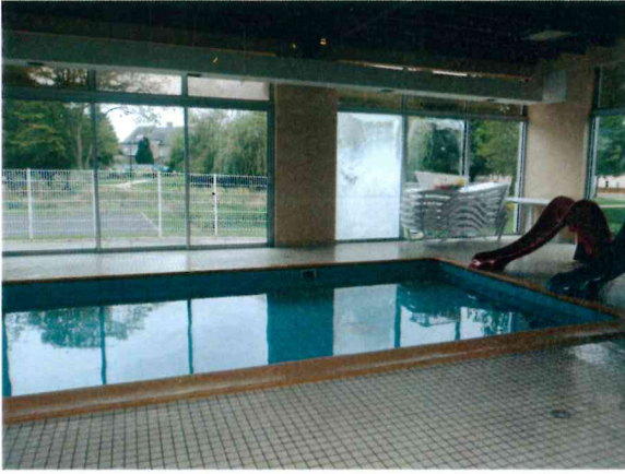
Le petit bain.